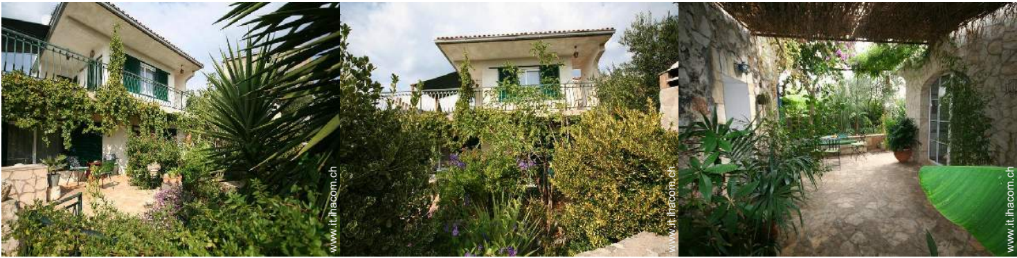
Casa di Charme