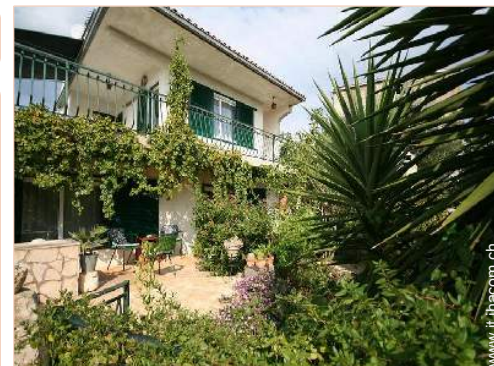
Casa di Charme