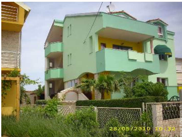
Proprietà di Charme