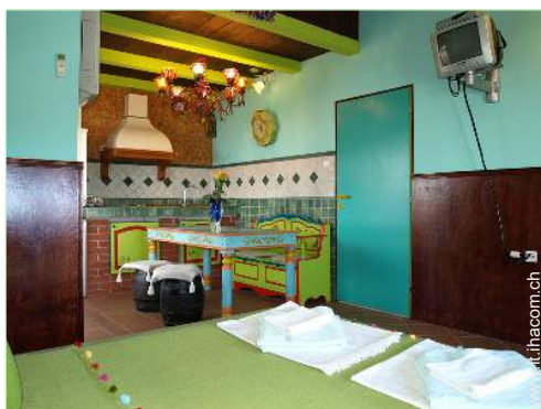
Appartamento di Charme