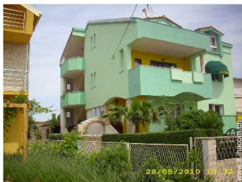
Proprietà di Charme