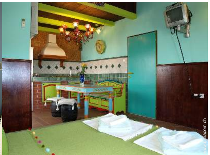
Appartamento di Charme