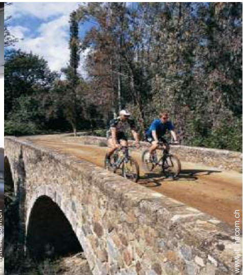
percorso per mountain bike