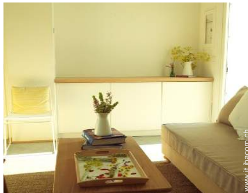
Bungalow di Prestigio