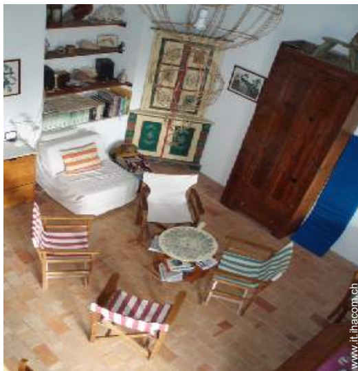
vista dal mezzanino