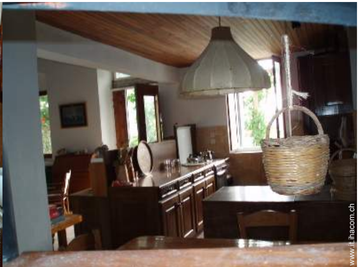
grande cucina in stile americano