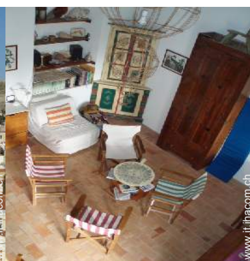
vista dal mezzanino