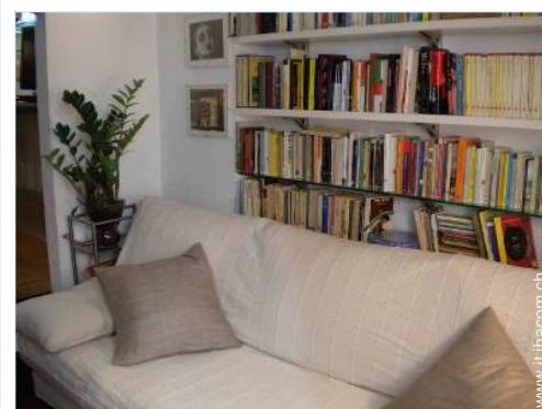
divano(i) letto 1 pers