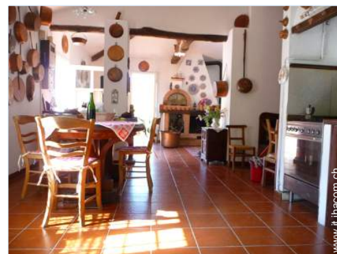
Disposizione interna e confort

Forno per pizze, barbecue, tavolo da giardino, 6 sedia(e) da giardino, 2 chaise(s) longue(s), 1 sedia sdraio