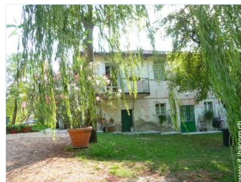
Casa in Pietra