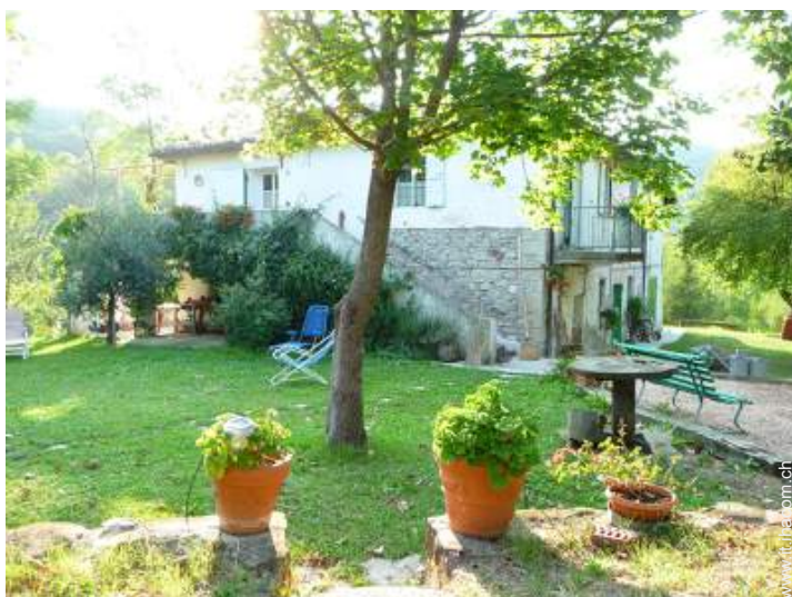
Casa in Pietra