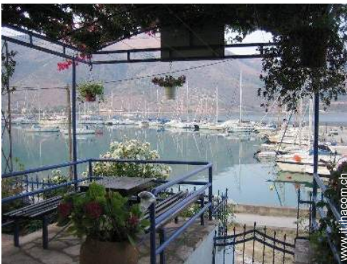
vista sul porto