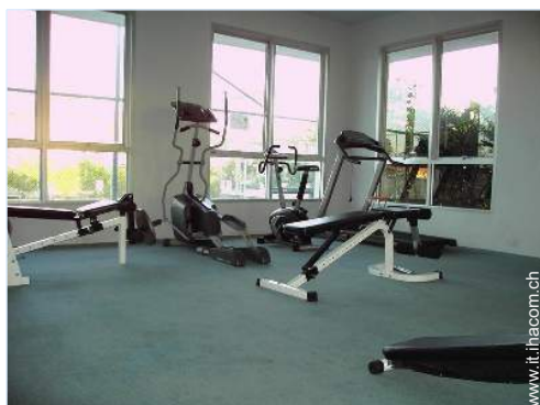
Attrezzature a disposizione