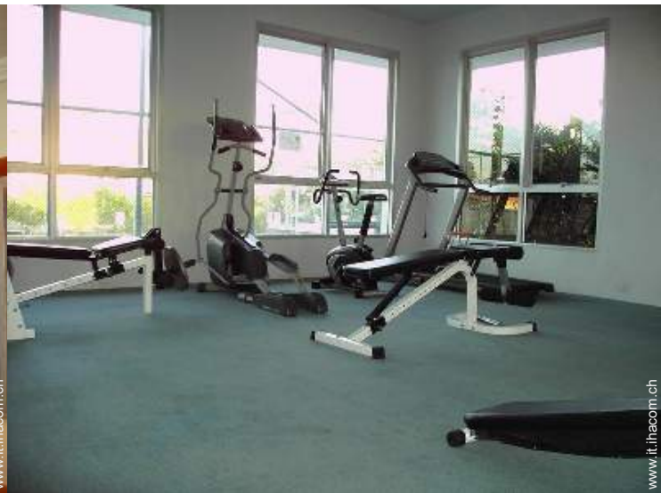
Attrezzature a disposizione