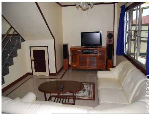
sala di musica