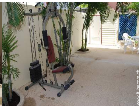
attrezzo(i) per il fitness