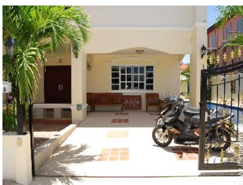
vista dal patio