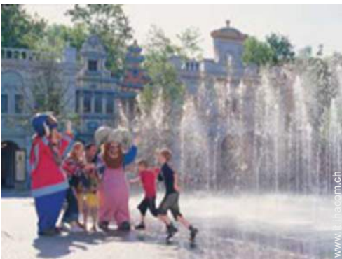
parco dei divertimenti