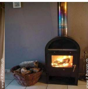
stufa a legna