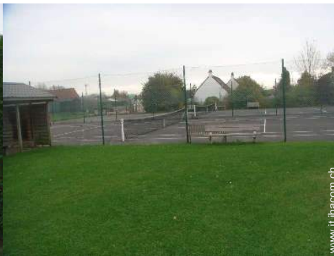
Tennis - superficie dura