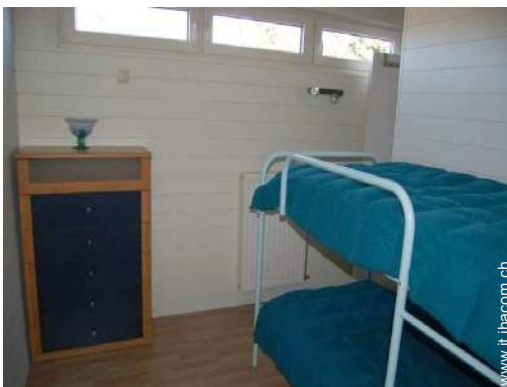
letti a castello