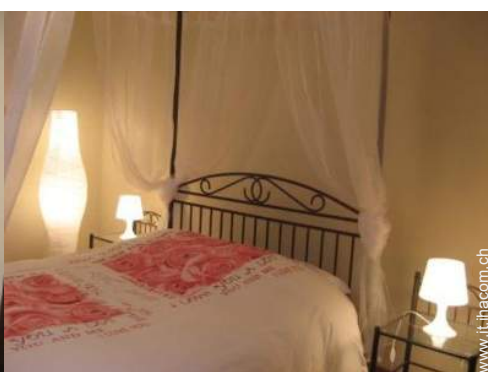
letto(i) matrimoniale(i) a baldacchino