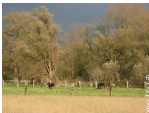
vista sul prato