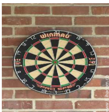
gioco delle freccette