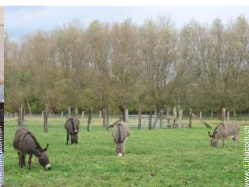
vista sul prato