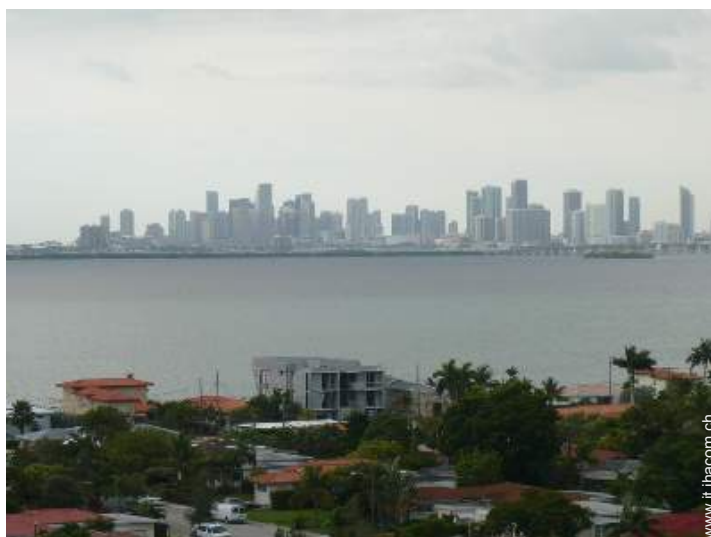
vista sulla città