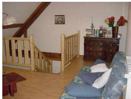
vista dal mezzanino