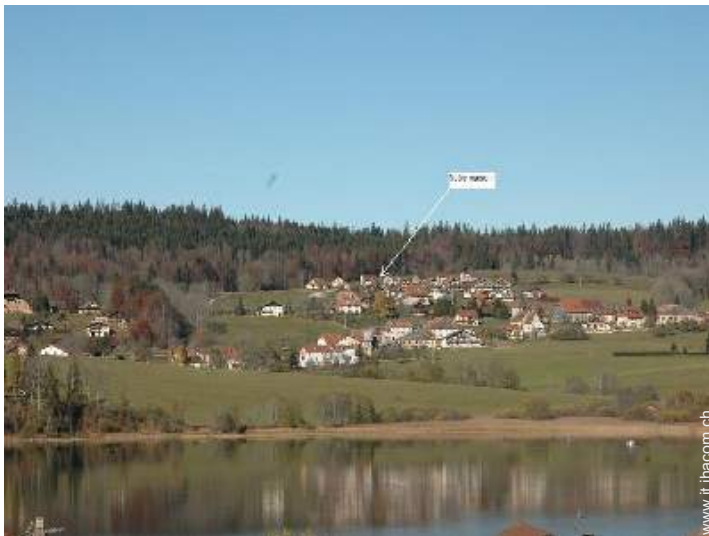
vista sul villaggio