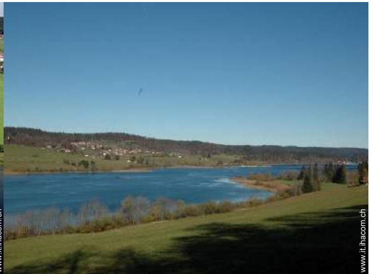
vista sul lago