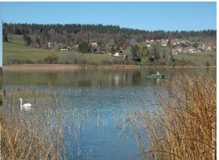
vista sul lago