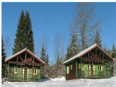
Chalet di Montagna