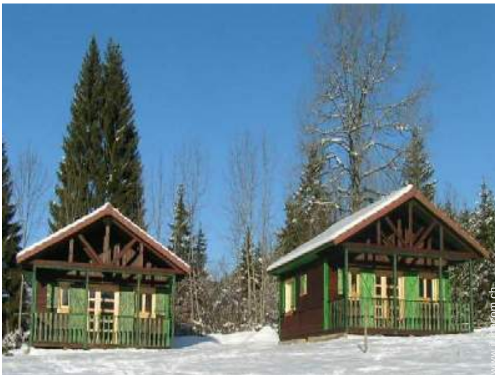
Chalet di Montagna