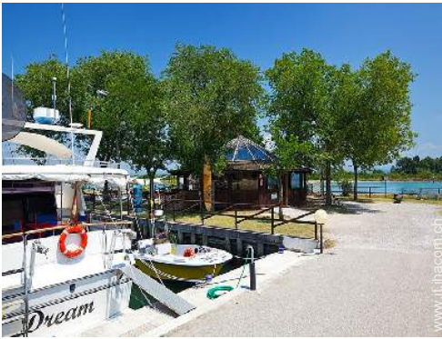
posto barca al porto