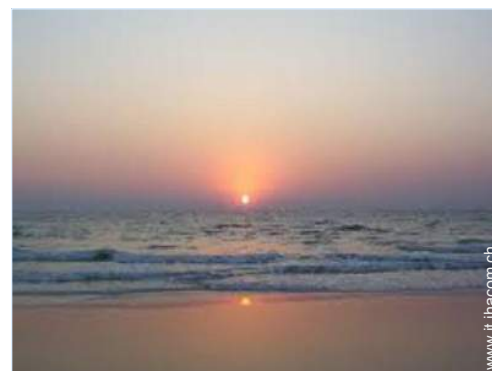
vista sulla strada pedonale