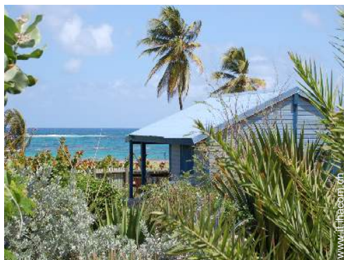
Bungalow di Charme