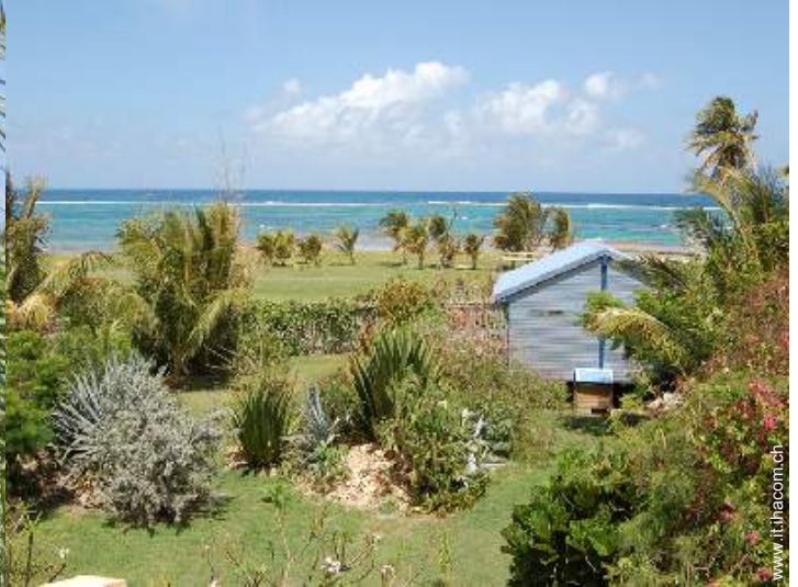
Bungalow di Charme