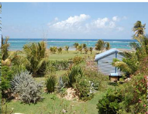
Bungalow di Charme