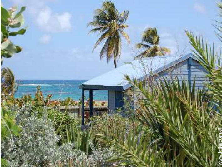
Bungalow di Charme