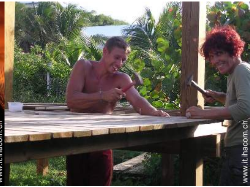
I vostri ospiti