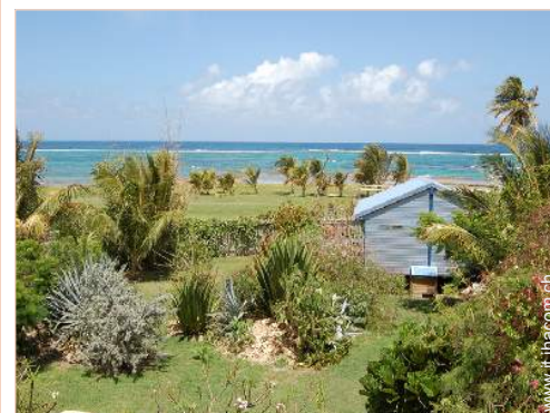
Bungalow di Charme