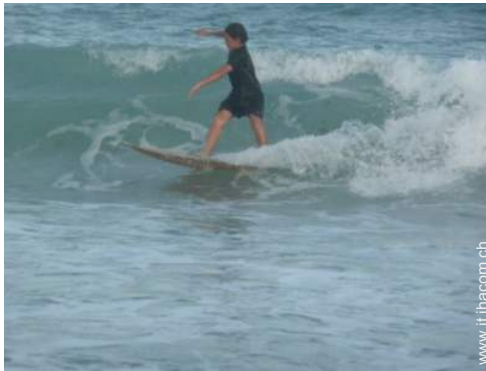
sport acquatici nelle vicinanze