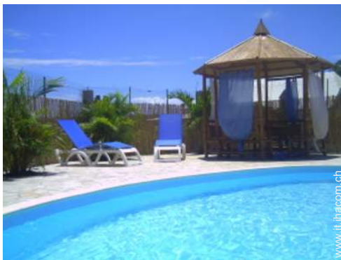
wifi (accesso ad internet senza filo)