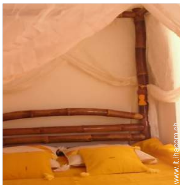
Proprietà di Charme

Privilegi : Accesso diretto alla spiaggia