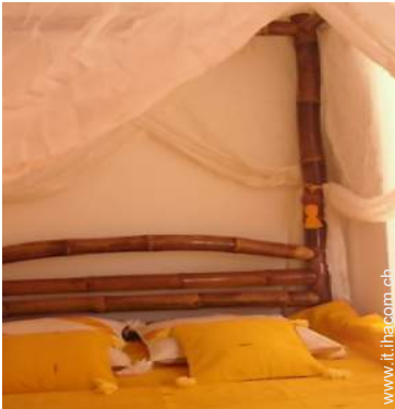
Proprietà di Charme