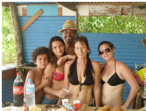
I vostri ospiti