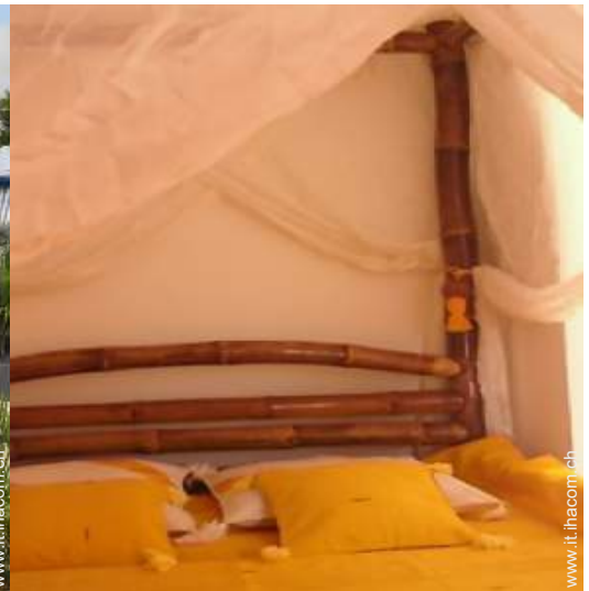
Proprietà di Charme