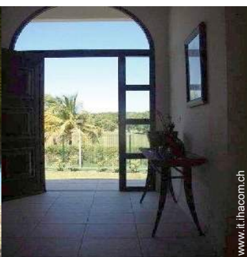
percorso di golf privato