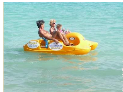
Villa di Prestigio

Salotto estivo, barbecue, barbecue a gas, tavolo da giardino, 10 sedia(e) da giardino, ombrellone, salotto da giardino, 10 chaise(s) longue(s), 10 sedia sdraio, 1 amaca(che), doccia esterna