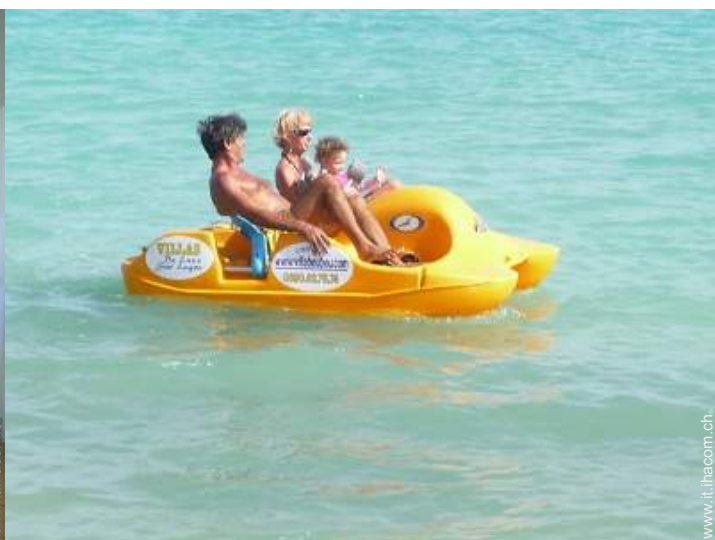
Villa di Prestigio