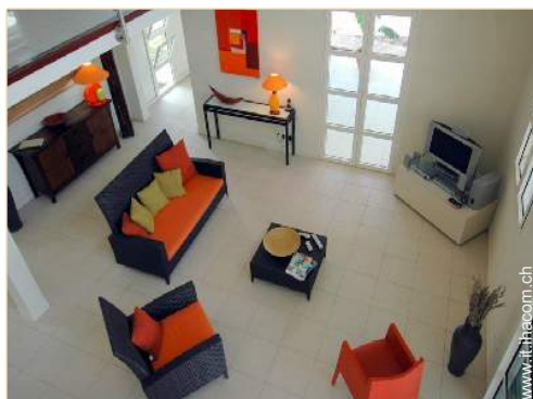
vista dal mezzanino