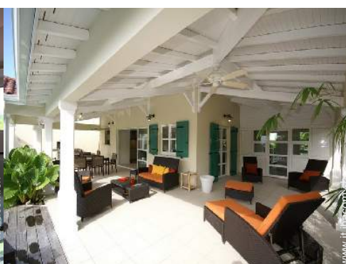
Villa di Prestigio