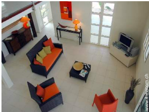
vista dal mezzanino