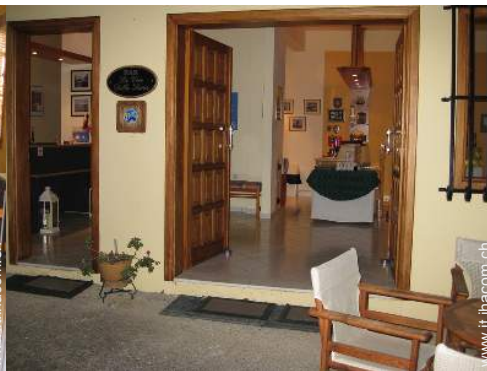
wifi (accesso ad internet senza filo)