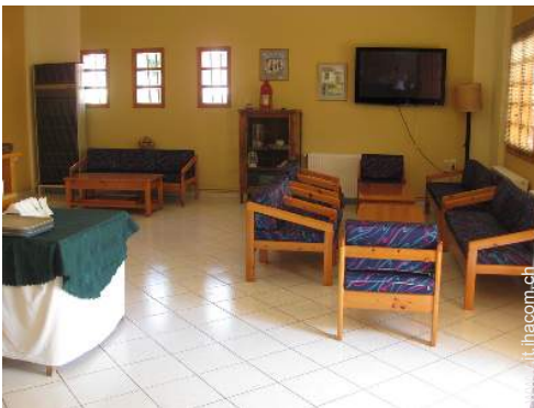
wifi (accesso ad internet senza filo)