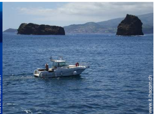
pesca in alto mare