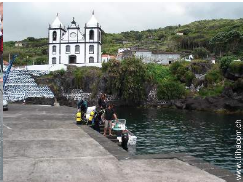
immersione con scafandro