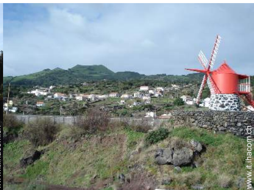
antichità &#38; anticaglie