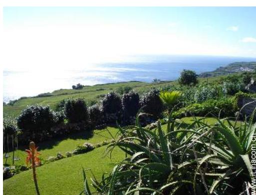
struttura rampicante per bambini