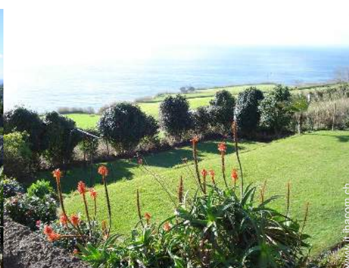
vista sui campi agricoli