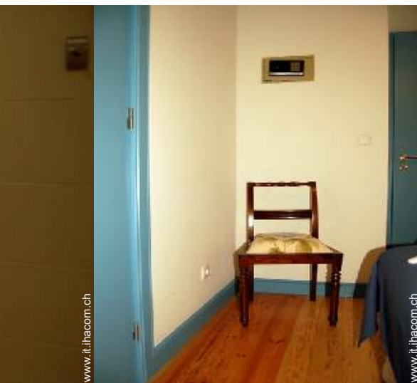
cassetta di sicurezza