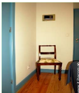
cassetta di sicurezza