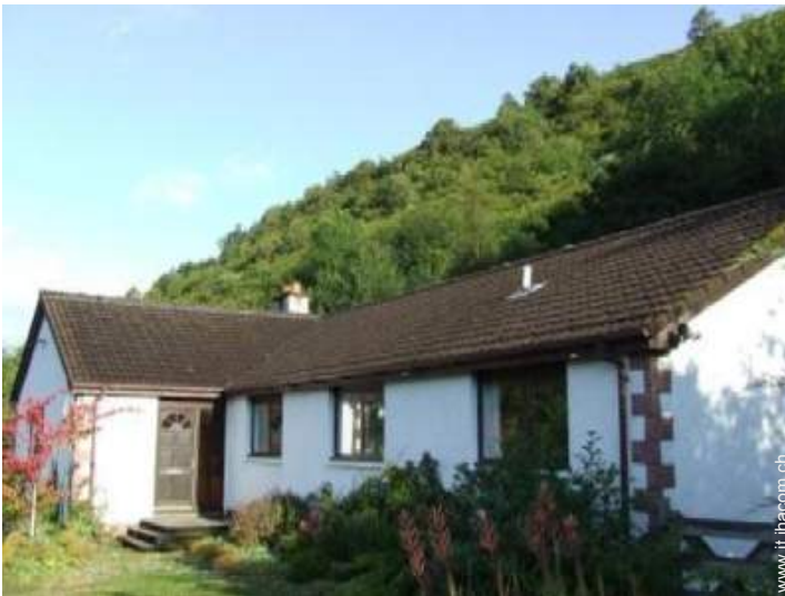
Bungalow di Prestigio