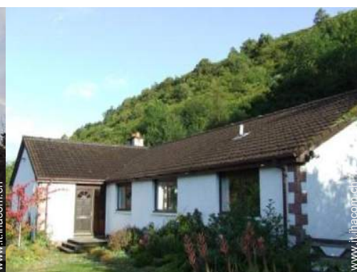
Bungalow di Prestigio