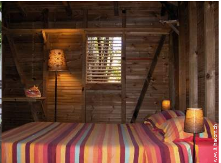
Capanna di Charme