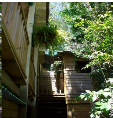
Capanna di Charme