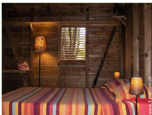
Capanna di Charme