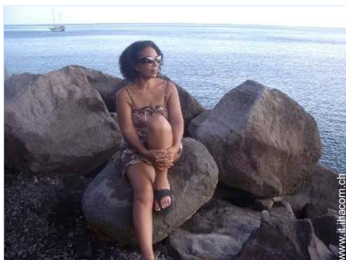
Il vostro ospite