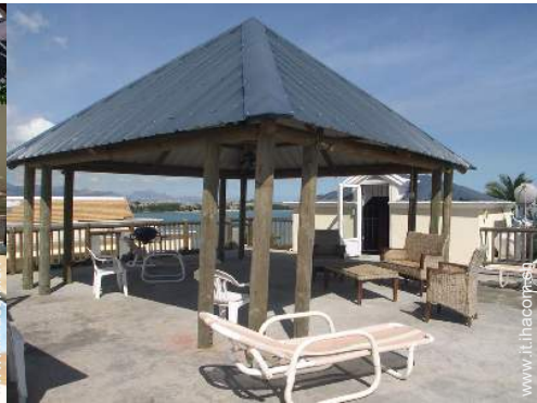
terrazzo sul tetto