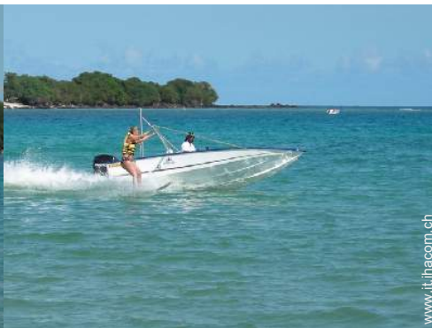
sport acquatici nelle vicinanze