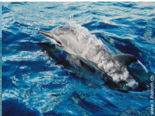
escursione in barca