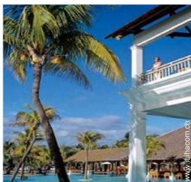
attrezzature ricreative nelle vicinanze

Privilegi : Accesso diretto alla spiaggia