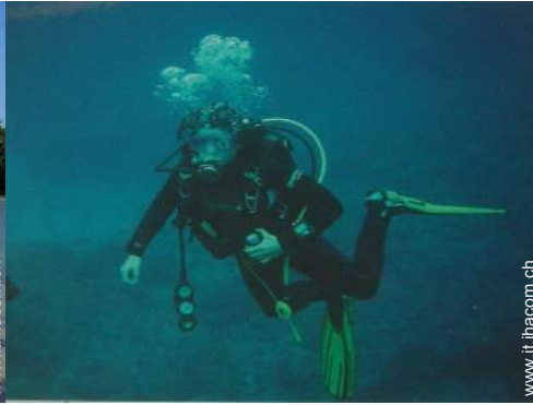
immersione con scafandro