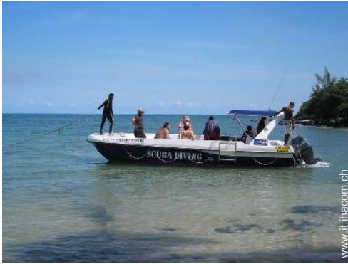
scuola di immersione