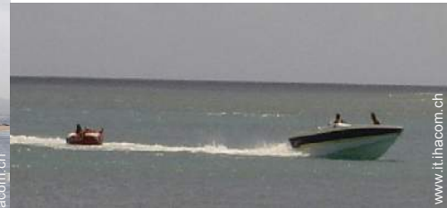
sport acquatici nelle vicinanze