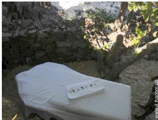
lettino da massaggio