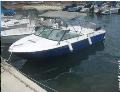
escursione in barca