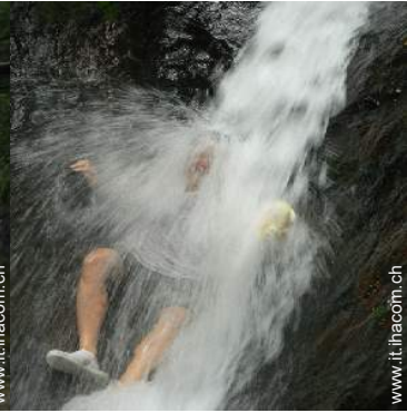
attività montane nelle vicinanze