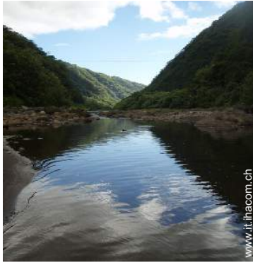
attività montane nelle vicinanze