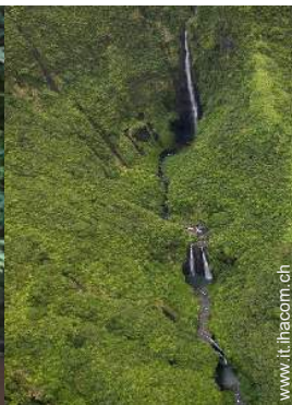
attività di volo nelle vicinanze