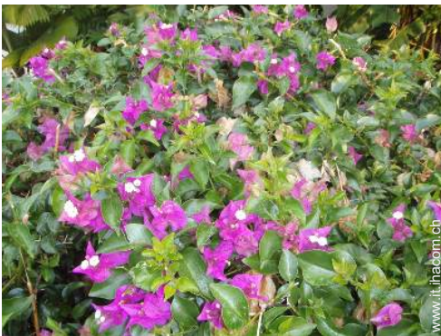
Ambito esterno a disposizione degli ospiti