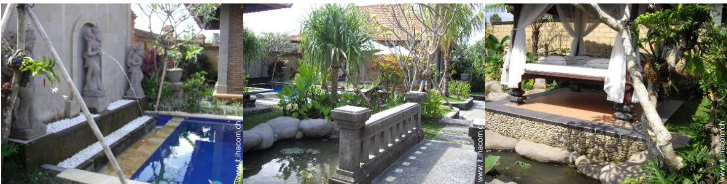
piscina fuori terra