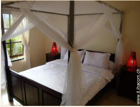
letto(i) matrimoniale(i) a baldacchino