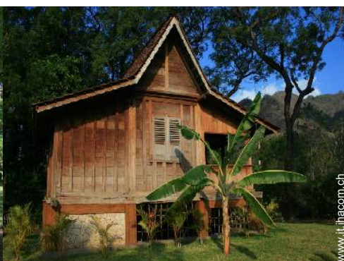
possibilità letto(i) supplementare(i)