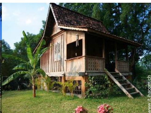
possibilità letto(i) supplementare(i)