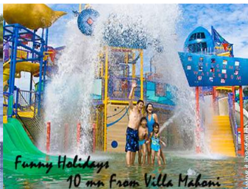
Funny Holidays 10 mn from Villa Mahoni