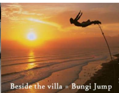
Beside the villa = Bungi Jump