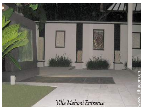
Villa Mahoni Entrance