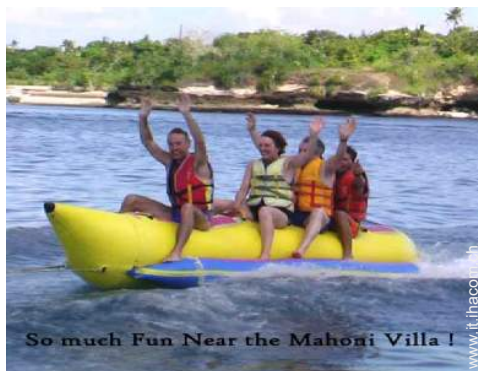
So much Fun Near the Mahoni Villa !