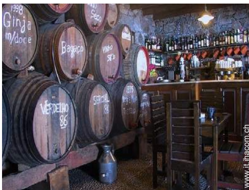
cantina e degustazione di vino