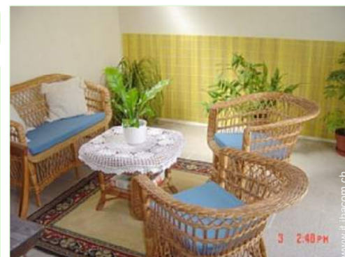
Disposizione interna e confort

Salotto estivo, tavolo da giardino, 6 sedia(e) da giardino, ombrellone, 2 chaise(s) longue (s)