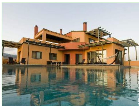
Piscina con acqua di mare

Stoviglie/posate, utensili e batteria da cucina, caffettiera, caffettiera elettrica, macchina per il caffè espresso, bollitore elettrico, tostiera, spremiagrumi, robot da cucina, griglia, cucina a gas, piastra di cottura elettrica, forno, cappa aspirante, frigorifero, congelatore, lavastoviglie, lavatrice, asciugatrice, aspirapolvere, ferro da stiro, asse da stiro