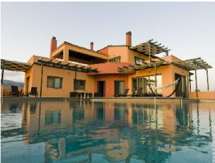
Piscina con acqua di mare