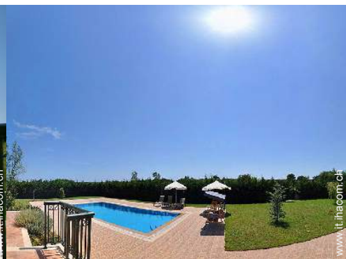
Piscina a sfioro