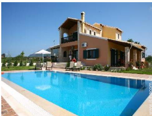
Villa di Prestigio