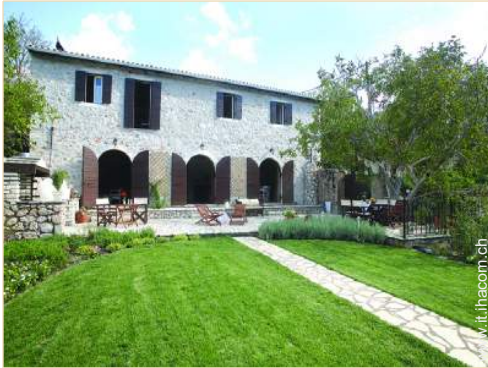
Palazzotto di Prestigio