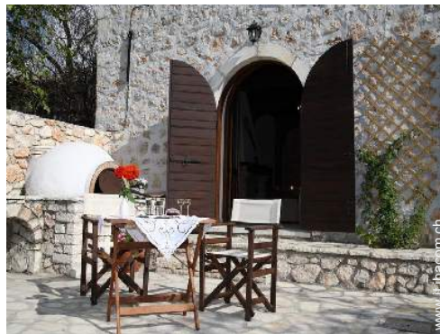
forno per pizze