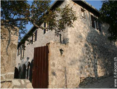
Casa in Pietra di Prestigio