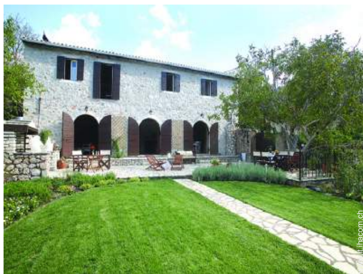
Palazzotto di Prestigio