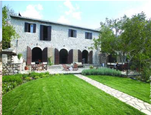
Palazzotto di Prestigio