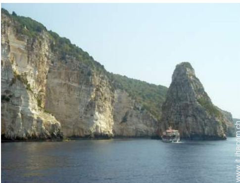
escursione in barca