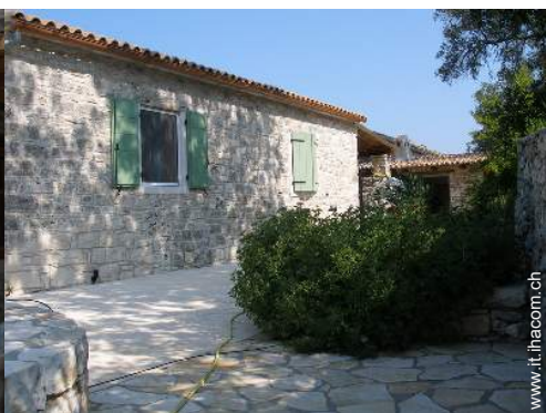
vista sul cortile