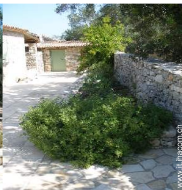
vista sul cortile