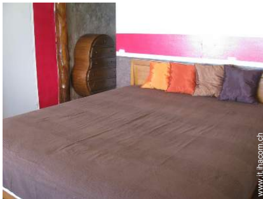
camera del proprietario