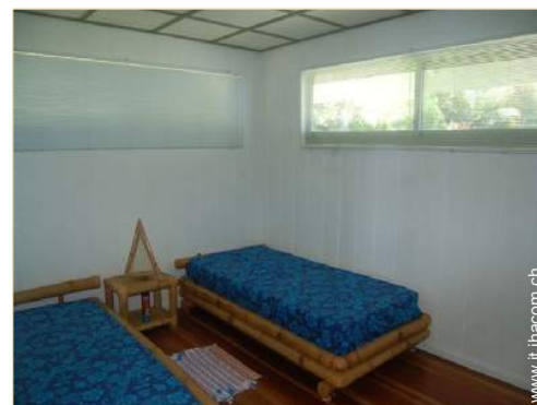
stanza degli ospiti

Tavolo da giardino, salotto da giardino, 2 sedia sdraio