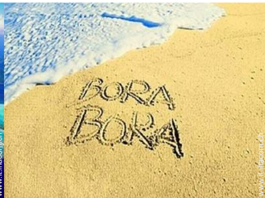
luogo per bagnarsi