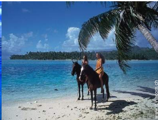
passaggiata a cavallo