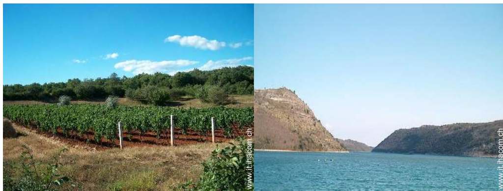
vista sui vigneti