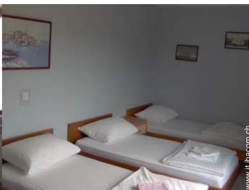
possibilità letto(i) supplementare(i)