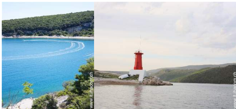
barca a motore